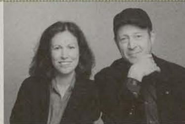
Beryl Korot et Steve Reich

Document de communication du Festival d'Automne à Paris - tous droits réservés