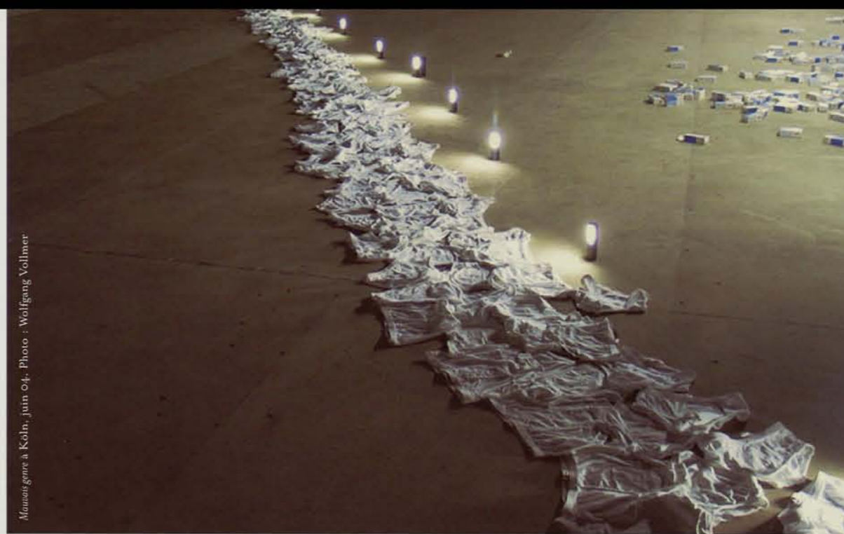
Mauvais genre à Köln, juin 04