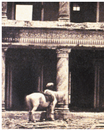
Ossements déterrés à Secundrabagh (Secundera Bagh) Photographie sur papier albuminé (détail) réalisée en 1858 par Felice Beato, témoin de la révolte des Cipayes (1857-1858 – Indes britanniques)

Seen at Secundrabagh prend pour point de départ un extrait textuel de The Surface of Each Day is Another Planet de Raqs Media Collective. Ce passage se compose d'annotations sur une photographie prise par le photographe itinérant Felice Beato à Lucknow dans le nord de l'Inde, en 1858, à la suite d'une « mutinerie » dans l'armée de la Compagnie des Indes orientales – mutinerie qui a finalement mené à la consolidation du pouvoir de l'Empire britannique en Inde. Cette photographie montre une composition avec un cheval blanc, ses quatre palefreniers, et des squelettes humains qui jonchent le sol devant les ruines d'un bâtiment néo-classique venant d'être pilonné. La performance évolue à partir de ce cliché, auquel sont intégrés des vidéos et du matériel performatif.