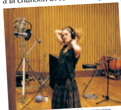
Vanessa Paradis enregistrant « Divinidylle ».

Après dix ans de famille, le couple de l'acteur américain Johnny Depp, Vanessa Paradis n'avait pas enregistré de disque depuis sept ans. Conçu en collaboration avec Mark Ronson, le disque, qui a assuré les observations, son nouvel album, « Divinidylle », marque son retour à la chanson. Un disque plaisir qui vient vingt