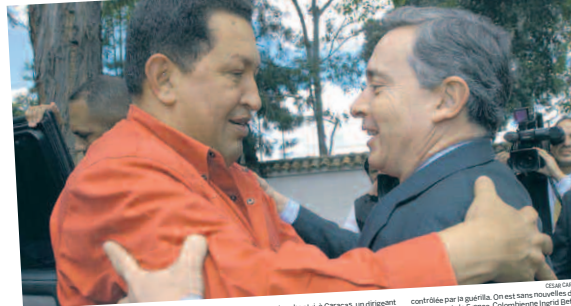
Le président colombien Álvaro Uribe (droite), à reçu, vendredi 31 août à Bogotá, son homologue vénézuélien, Hugo Chavez, pour discuter de la situation des otages retenus par les partisans des FARC. M. Uribe a donné son feu vert à Hugo Chavez pour qu'il revienne chez lui, à Caracas, un dirigeant des FARC. M. Chavez, qui se présente comme le porte-parole d'une nouvelle révolution sociale, offre sa médiation pour obtenir la libération des otages et d'autres prisonniers des FARC dans la région de Colombie contrôlée par la guérilla. On est sans nouvelles depuis quatre ans de la Franco-Colombienne Ingrid Betancourt, qui figure parmi les otages. Nicolas Sarkozy a demandé à M. Chavez d'obtenir au moins la preuve que M lle Betancourt était toujours en vie. Lire page 5