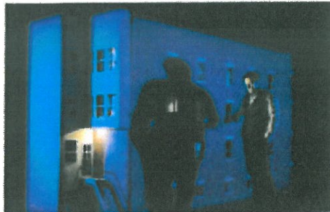
🔍 Le spectacle de Robert Lepage se joue au théâtre de la Ville, à Paris.

Le metteur en scène québécois Robert Lepage ouvre la manifestation avec 887 , un spectacle en solo sur son histoire personnelle et celle de son pays.