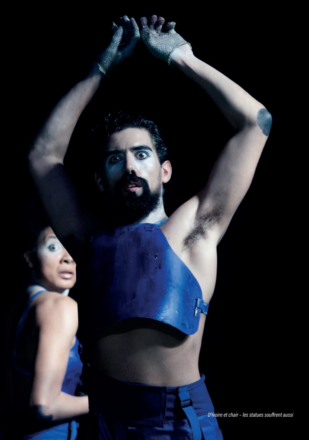
D'ivoire et chair - les statues souffrent aussi