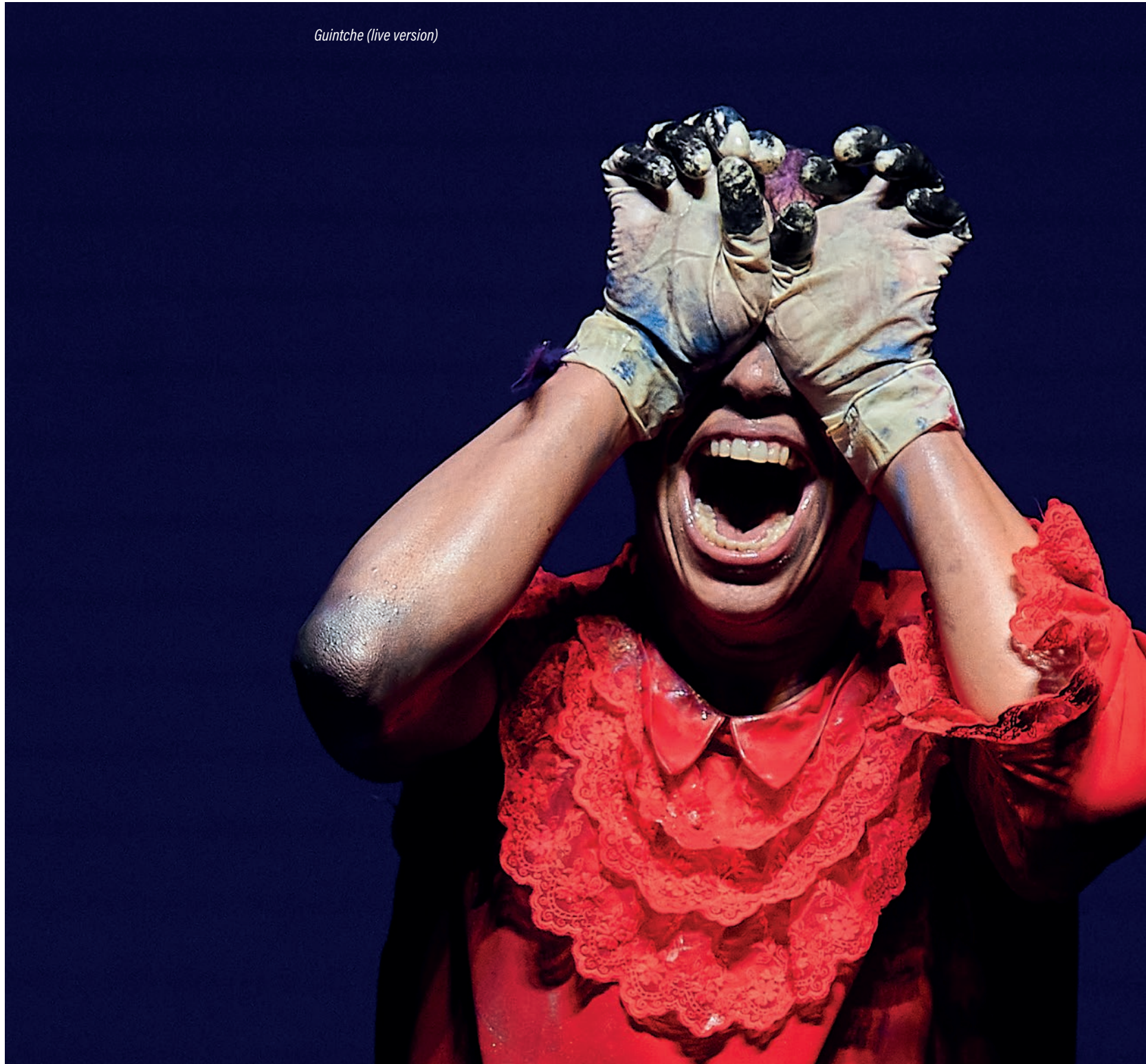
Guintche (live version)