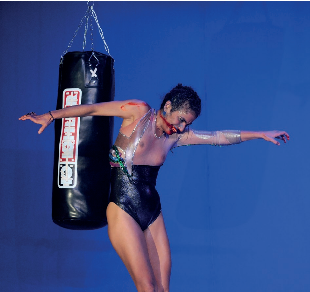
Guintche (live version)