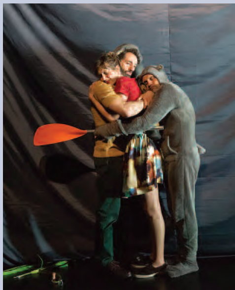
Tristesse et joie dans la vie des girafes de Tiago Rodrigues, mis en scène par Thomas Quillardet au Théâtre de Gennevilliers.

Tristesse et joie dans la vie des girafes Tiago Rodrigues et Thomas Quillardet proposent un spectacle jeune public qui